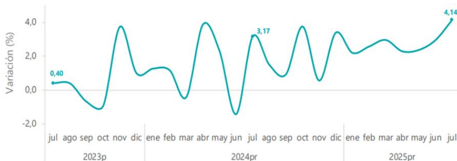
Gráfico 5. Tasa de crecimiento anual del índice del Indicador de Seguimiento a la Economía (ISE) Serie ajustada por efecto estacional y calendario 2023 p - 2025 pr (julio)

Para el mes de julio de 2025 pr el ISE en su serie ajustada por efecto estacional y calendario, se ubicó en 127,89, lo que representó un crecimiento de 4,14% respecto al mes de julio de 2024 pr (122,81).