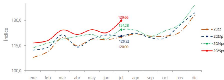
Gráfico 2. Índice del Indicador de Seguimiento a la Economía (base 2015) Serie original 2022 - 2025 pr (julio)